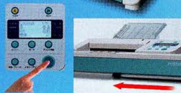
オートカッター機能