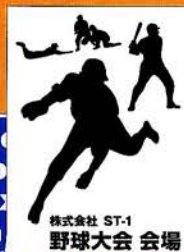
株式会社 ST-1 野球大会 会場

ABCDEFGHIJ JKLMNOPQR STUVWXYZ abcdefghijklmnop qrstuvwxyz